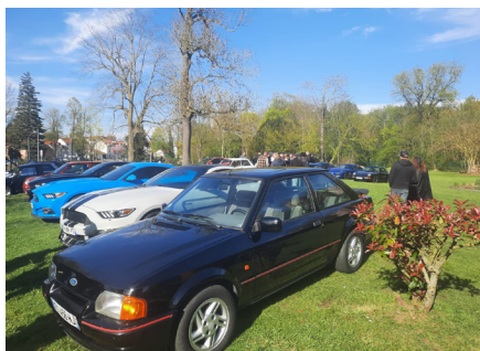
Exposition Voitures d'exception Samedi 4 avril