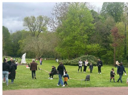
Chasse aux oeufs Dimanche 5 avril