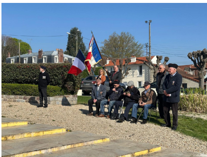
Commémoration du 19 mars 1962