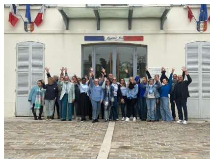
Journée mondiale de l'autisme 2 avril