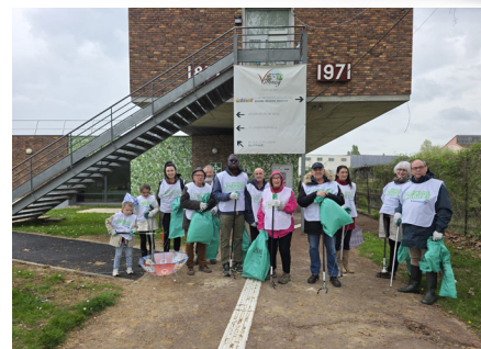
Défi 77 pour l'environnement Samedi 11 avril